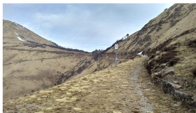
A piedi verso Passo Fobello