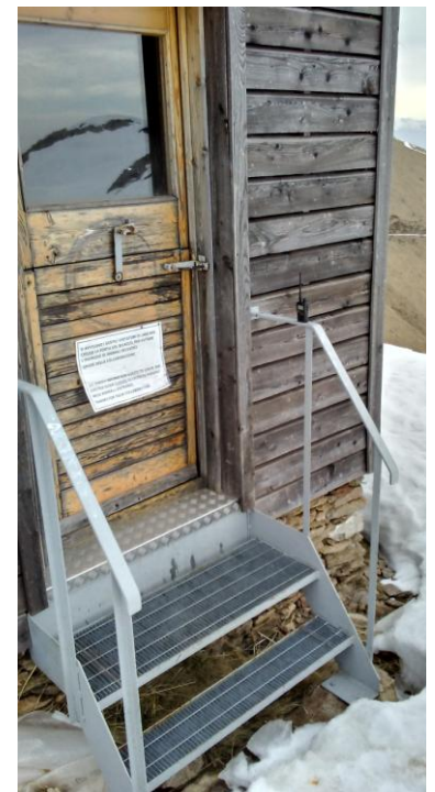
Ricovero invernale Vadà.