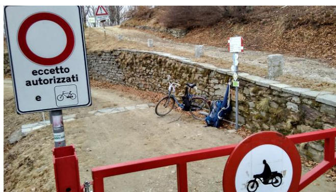
Al bivio per Alpe Archia